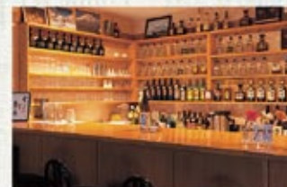
スナック ひとりしずか