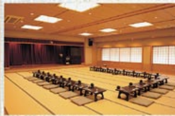
宴会場 いわかがみ 最大100名様までご利用できる大広間です。大小のご宴会のほか、会議・研修の場としてもご利用いただけます。