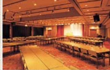
コンベンションホール ゆぎつばき 会議、ご宴会、ご婚礼、ご披露宴など、最大300名様がご利用いただける多目的ホールです。