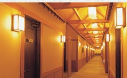
舟底造りの天井が特徴の客室廊下にあたたかな灯りがとまります。

エントランスからエレベーターで2階へ上がっていただければ、すべてがワンフロア。どなたにもやさしい、ゆったりとした、くつろぎの空間です。