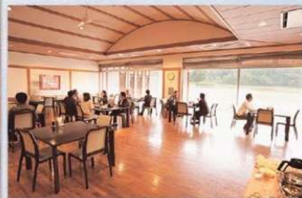
広い前庭を望むレストラン「ゆきんこ」