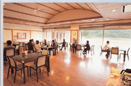
広い前庭を望むレストラン「ゆきんこ」